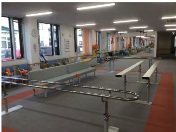
< ▲施設内の機能訓練設備 >

利用者様は歩行訓練の他にも、様々な体操や 運動を取り入れて身体機能の維持向上を目 指し、機能訓練に励んでおります。