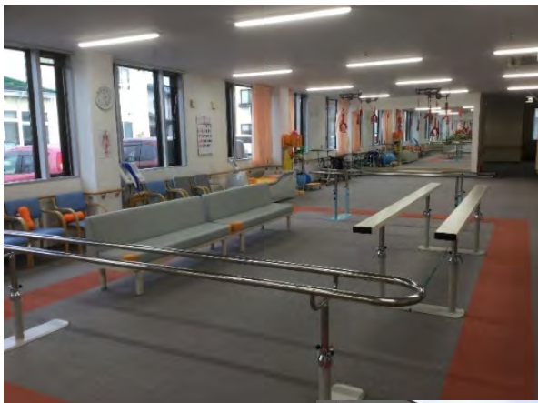
< ▲施設内の機能訓練設備 >

利用者様は歩行訓練の他にも、様々な体操や 運動を取り入れて身体機能の維持向上を目 指し、機能訓練に励んでおります。